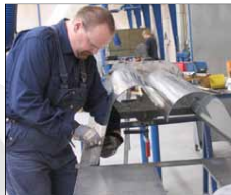
Samling af trugdele til færdigt hus