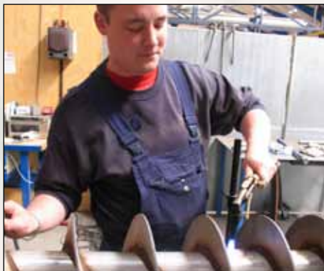
Oprettning af rustfri sneglerotor