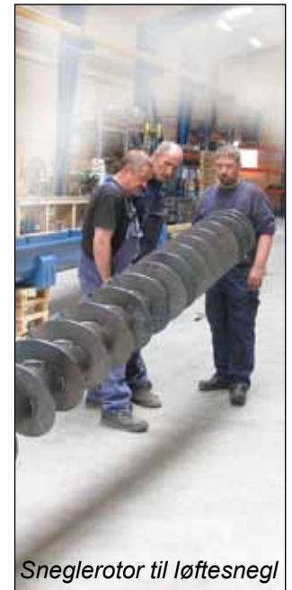
Sneglerotor til løftesnegl

Fordelersystem bestående af to snegle og modtagerbuffer. Komplet levering incl. spjæld og understøtning samt engineering/konstruktion.